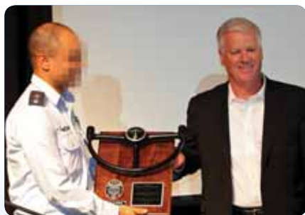
נציג בואינג מעניק את הגה מטוס B-17 למפקד הטייסת

מועדון טייסת 69 בעמותה, ערך כנס חגיגי ב-4.10.11 בבית חיל האויר שבהרצליה. במפגש השתתפו ותיקי ובוגרי הטייסת, והסדירים. כיבדו את הערב ארבעה סגני נשיא מחב' בואינג, שהעניקו לטייסת "הגה" של מפציץ B-17 אשר שירת בטייסת במלחמת השחרור.