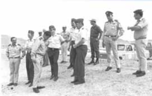
1979 - מפקד בסיס עובדה המיועד, אלי"מ מנחם שרון (שני מימין) וראש מנהלת הקמת שדות התעופה תא"ל משה ברטוב (שלישי משמאל), עם קצינים אמריקאים בסיוור בתחילת העבודות בעובדה