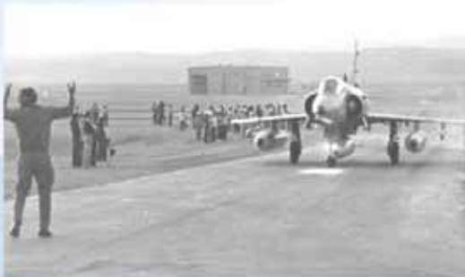
8.11.1981 - כפיר נוחת בבסיס עובדה בעת חנוכת הבסיס

באוקטובר 1983 נחנך הבסיס החדש בנבטים, שהיה האחרון מבין בסיסי חיל האוויר שהוקמו במימון אמריקאי בעקבות פינוי בסיסי החיל בסיני בהתאם להסכמי קמפ דייוויד. בבסיס מוצבות כיום טייסות מטוסי קרב מדגם F-16A/B ("נץ"). בהן נערכים קורסי הקא"מ (קורס אימון מבצעי) וקאמ"מ (קורס אימון מבצעי מתקדם), שאליהם מגיעים טייסי הקרב בחיל לאחר סיום קורס הטיס. החל מאוגוסט 2008 מוצבות בבסיס היחידות וטייסות התובלה שהיו מוצבות בעבר בבסיס חיל האוויר בלוד.