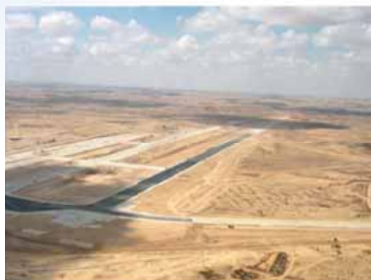
המסלול החדש בנבטים (2008) שלושה וחצי ק"מ, הארוך במזרח התיכון

הקשור בתכנון ובאישורים הנדרשים. האמריקאים העדיפו להתחיל בבניית עובדה ורמון מאחר והקרקע שנועדה לבסיס נבטים לא היתה זמינה בגלל ישובי בדווים במקום. בסיס נבטים שבנייתו החלה באיחור נבנה על ידי קבלנים ישראלים. בסיס רמון הוקם וקלט את שדה "איתם" שפונה מסיני. הבנייה בפועל בוצעה בידי פועלים פורטוגזים רבים כאשר מהנדסים אמריקאים מפקחים עליהם. בבסיס רמון פועלים שני מסלולי המראה מקבילים שמהם מתבצעות הנחיתות וההמראות. בניית הבסיס הושלמה ב-15 באוקטובר 1981 וטייסת 140 על מטוסי העיט שלה עברה מעציון וחנכה את בסיס רמון. ב-16 בפברואר 1982 נחתו מטוסי הנץ של טייסת 253 ברמון. ב-17 במאי 1982 הכריז שר הבטחון על הבסיס כמבצעי. עשרים ושתיים שנים לאחר מכן, באפריל 2004 נחתו בבסיס שני מטוסי ה-F-16 ("סופה") הראשונים של חיל-האוויר, ונקלטו בטייסת ה"סופה" הראשונה של החיל, אחות בכורה לטייסות נוספות בבסיס