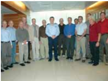
בלשכת מפקד חיל האויר