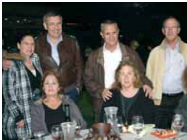
מפקד חיל האוויר ונשיא העמותה מבקרים בטיול