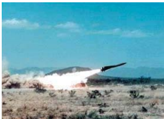
"הוק" בדרך אל המטרה

ראשית, היה צורך בהשלמת אמצעים וכלי עבודה לשם כך הזעקנו מבתיהם קבלנים להשלמת עבודתם ובאישור מנכ"ל התעשייה האווירית הוצאנו ממוחסניה כל שנחוץ להתחיל לעבוד. הוצאנו את הטיילים מהמכלים אל עמדות הבדיקה, לאחר בדיקת ההדבקה של נחיר הגרפיט עבר הטייל לבדיקת ראש הביות, ובסיום הבדיקות חזר הטייל למכל ונשלח אל הסוללה אליה יועד. בהמשך עסקנו בהרכבת מנועים רקטיים וראשי ביות תקינים, ולבסוף הגענו לשלב של תיקון מנועים רקטיים וראשי ביות שצרכו תיקון. לאחר מספר ימים נכנסנו לקצב ומורל האנשים עלה. כעבור שבועיים עמד מספר הטיילים המבצעיים על 40 והמספר עלה כל יום. בשבועיים הבאים הגענו ל-80 טילים מבצעיים. מלאנו במלואה את