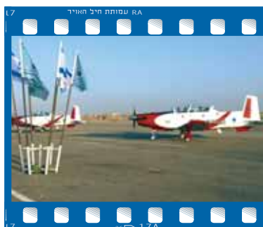
העפרונים נחתו בארץ ב-7.7.09