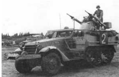
מימין ובכוון השעון: תותח "בופורס"; סוללת נ"מ ברמת דוד; צוות תותח "זולק" בחרמון; זוג תותחי 20 מ"מ מותקנים (בארץ) על נגמ"ש.

במהלך מלחמת ההתשה, ב-21 במאי 1969, נרשמה הפלה ראשונה עולמית להוק. סוללת הוק חדשה, שזה עתה הגיעה מארה"ב, פרסה בבלוזה שבסיני, צפונית לקנטרה, עקב פעילות מטוסי אויב מוגברת באזור. לפני הצהריים, ישב עוזר הבקר, יריב גבע, מול צג