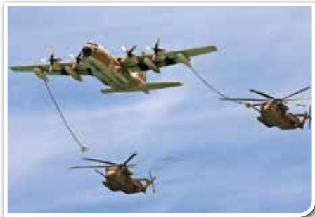
קרנף מתדלק זוג יסעורים

לקבלת הזמנה, אנא מלאו בהקדם את הטופס המצורף ושלחו בפקס/בדואר או התקשרו טלפונית למשרד העמותה 09-9510250 . כרטיסי ההזמנה יישלחו לבתיכם עד 9.6.14.