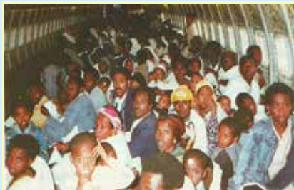
בדרך לישראל, 1076 עולים במטוס ג'מבו