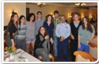
מפקד חיל האויר עם המשפחות