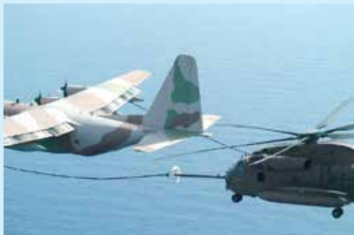
תדלוק יסעור מקרנף. צולם בטיסת אימון

צעדים הכרחיים למקרה בו יאלץ המסוק לנחות בשטח אויב, או יתגלה באור היום ההולך וקרב. אסף, קברניט הקרנף המוביל החליט שבן זוגו יתדלק את השלישייה והוא יטפל במסוק הפגוע והמלווה שלו שנשרכו כשלושים מיל מאחור. באין ברירה הדרו אסף וצוות הקרנף שלו לעומק שטח האויב, והנמיכו למפגש עם המסוק, משימה שאיש לא ביצע לפני כן: